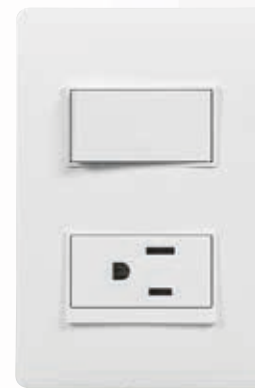
SPU1231 Interruptor sencillo y Tomacorriente 2P+T