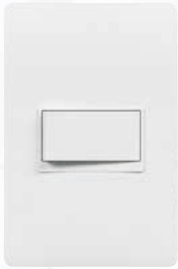
SPU1100 Interruptor sencillo SPU1101 Interruptor conmutable