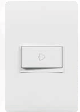
SPU1102 Pulsador para timbre