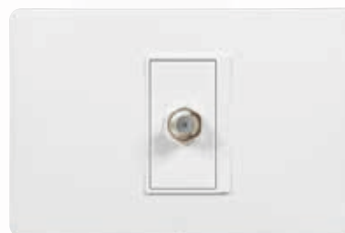
SPU1152 Salida coaxial con conector para TV