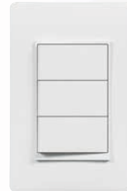
SPU1300 Interruptor triple SPU1301 Interruptor conmutable triple