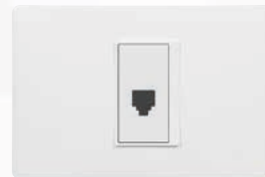
SPU1182 Salida telefónica RJ11, 2 hilos