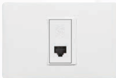
SPU1179C6 Salida voz y datos RJ45 categoría 6