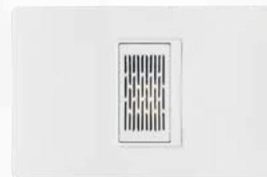
SPU1149V127 Zumbador 127 V