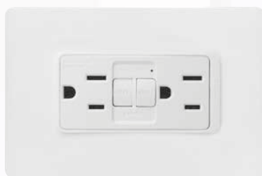
SPU1228GF Toma dúplex 2P+T con protección GFCI