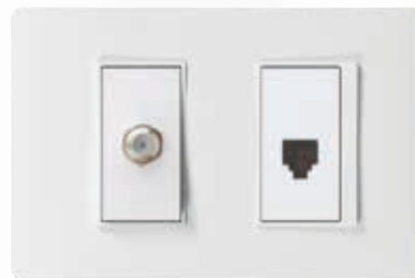
SPU1255 Salida coaxial con conector + teléfono RJ11, 2 hilos