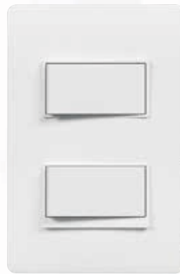
SPU1200 Interruptor doble