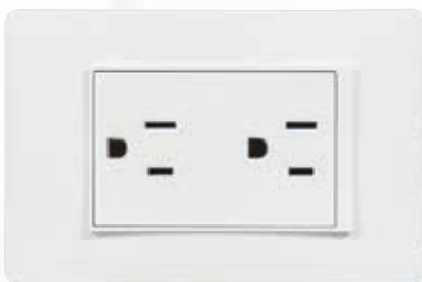
SPU1228 Tomacorriente dúplex 2P+T